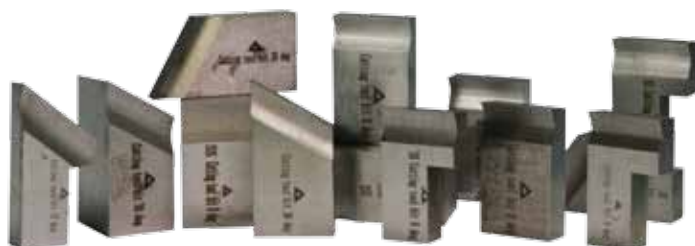
Řezné nástroje viz.strana 48 - 50