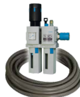
Obj. č. 27221 (pouze pro pneumatické modely)