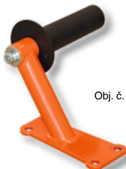
Obj. č. 29206