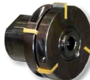
Obj. č. 29202