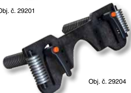
Obj. č. 29204