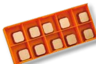
Obj. č. 29203