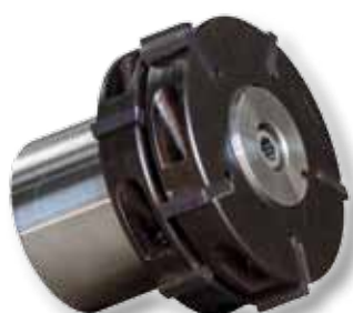
Obj. č. 29201