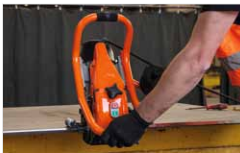
Precizní stupnice nastavení úhlu úkosu