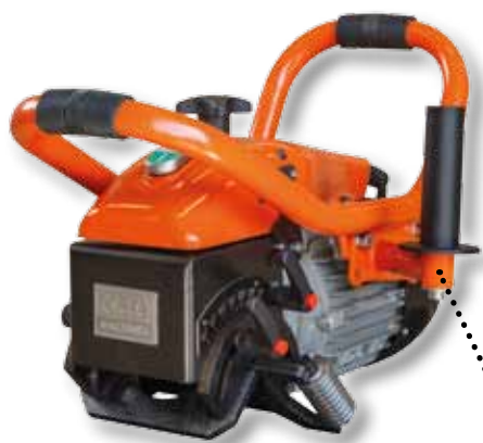
Přídavná polohovatelná rukojeť