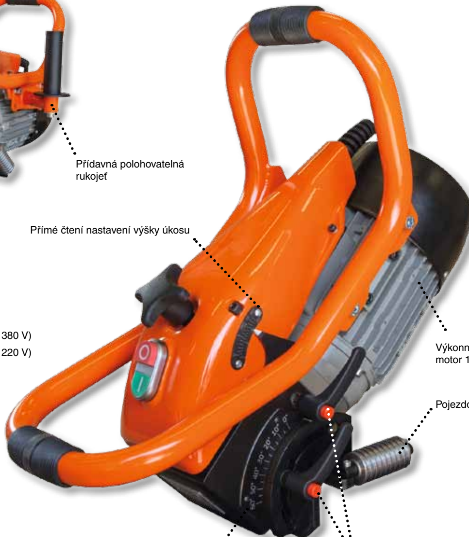
Výkonný 3-fázový motor 1100 W